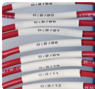
Koszulki termokurczliwe PermaSleeve® PS do oznaczenia przewodów