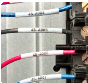
Samolaminujące oznaczenia przewodów i kabli