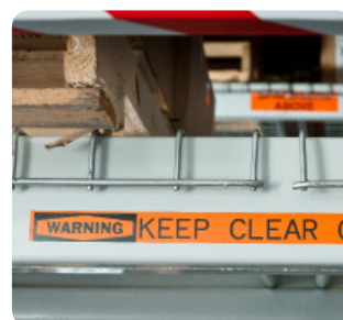
Oznaczenia do stosowania na zewnątrz/wewnątrz w zakładach produkcyjnych i oznaczenia dotyczące bezpieczeństwa