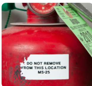
Oznaczenia odporne na zrywanie