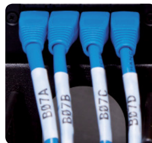
Samolaminujące oznaczenia kabli