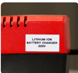
Oznaczenia do stosowania na nierównych powierzchniach