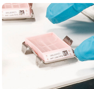
Etykiety na kasety na próbki tkankowe