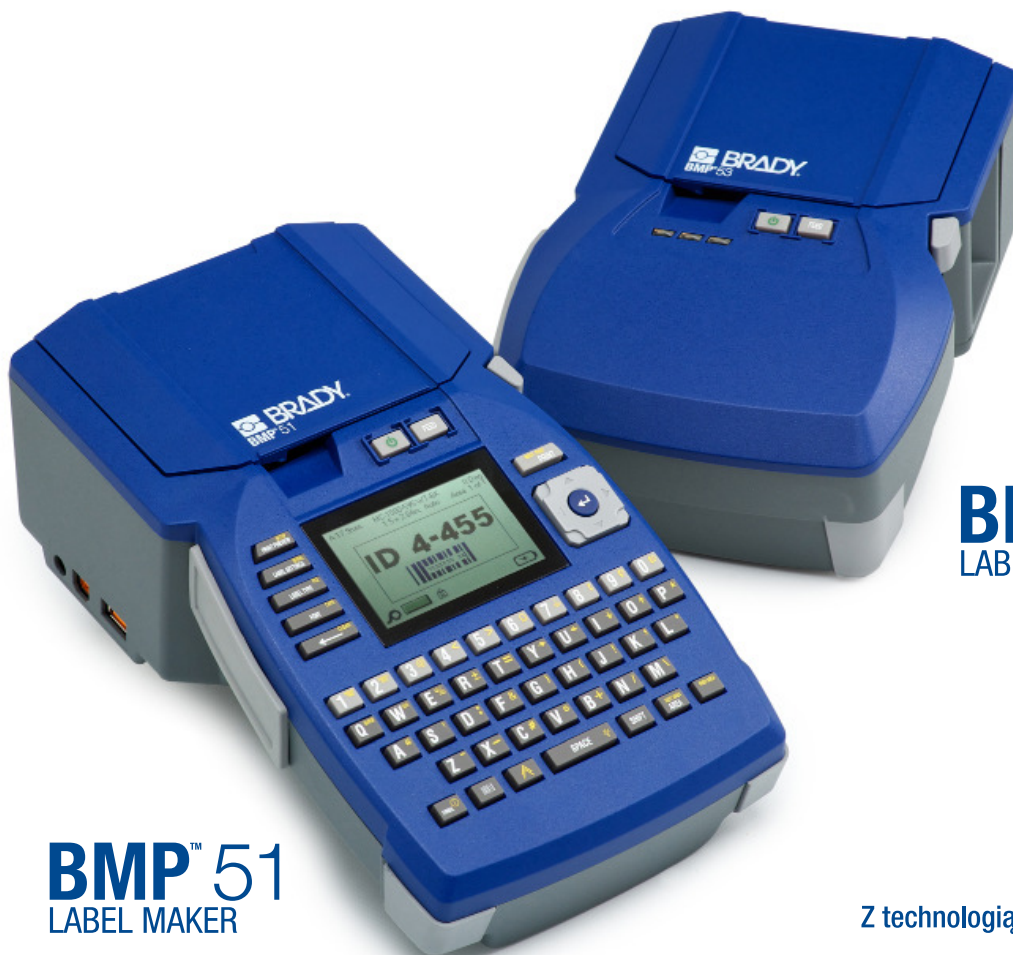
BMP™ 51 LABEL MAKER