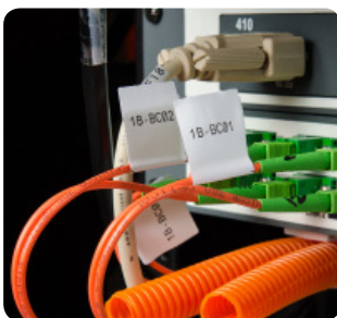
Etykiety z flagami do oznaczania kabli