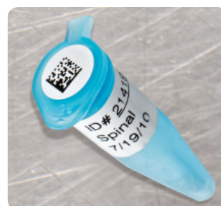
Etykiety przeznaczone do używania w wirówkach i próbkach PCR