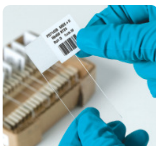
Etykiety na szkiełka