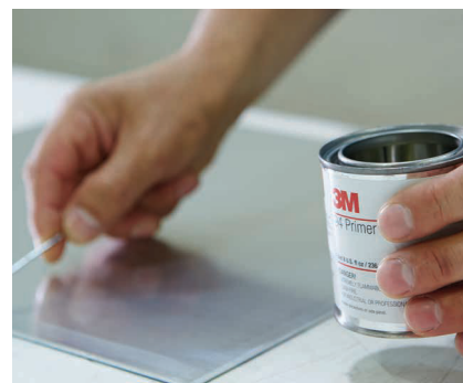
Krótki czas schnięcia umożliwia niemal natychmiastową aplikację taśmy.