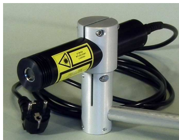
Mocowanie na pręcie Ø20mm