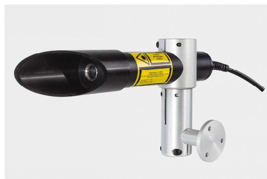
Laser z zamontowaną ochronną nasadką