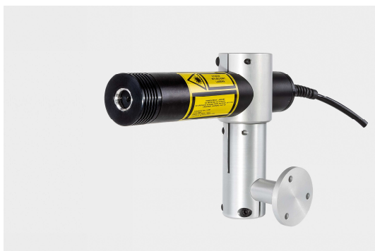
Laser bez ochronnej nasadki

Ochrona przeciwko oślepieniu (aluminiowa, zdejmowana nasadka, zwiększająca bezpieczeństwo i komfort pracy) – dostępna w zestawie, w cenie lasera: