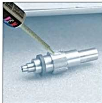
Klejenie magnesów do stalowych wirników.