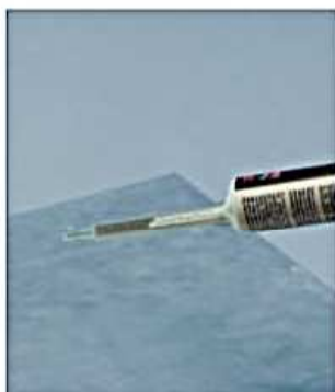
Pociągnij za spust aby rozpocząć nakładanie kleju - składniki są mieszane przy przechodzeniu przez dyszę.