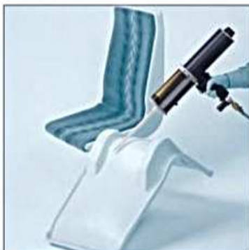
Klejenie elementów siedzisk (np. do autobusów).