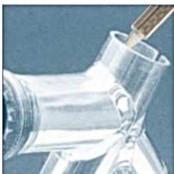
Klejenie elementów ram rowerowych (połączenie rurowe).