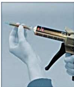
Zdejmij zakrętkę z końcówki kartusza, sprawdź drożność otworów wylotowych i zamocuj dyszę mieszającą.