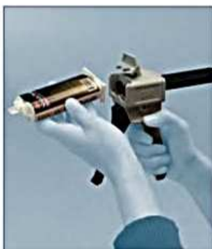
Wsuń kartusz do dozownika i zamknij blokadę.

System dwuskładnikowych klejów strukturalnych EPX jest gotowy do użytku i zastosowania po wykonaniu czterech, prostych czynności: