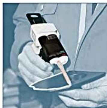
Przyklejanie elementów do tablicy rozdzielczej samochodu.

System dwuskładnikowych klejów strukturalnych EPX jest gotowy do użytku i zastosowania po wykonaniu czterech, prostych czynności: