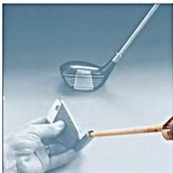
Sklejanie elementów sprzętu sportowego.