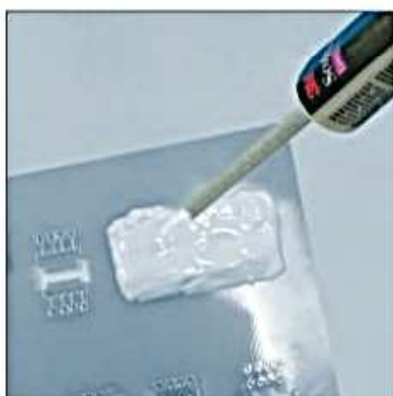
Zabezpieczanie układów scalonych przed ingerencją osób niepowołanych.